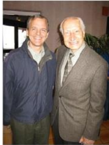
Bob Thieel gi