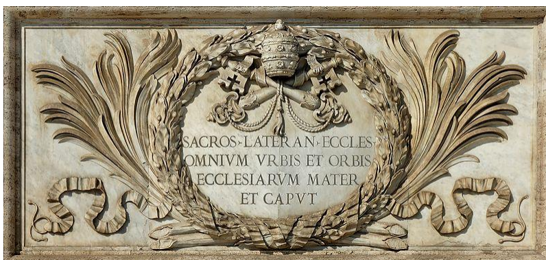
כיתוב על הבזיליקה של סנט ג'ון לאטרן

שים לב הכתובת הבאה, אשר ראיתי באופן אישי בנסיעות מרובות לרומא על החלק החיצוני של מה, במובנים מסוימים, היא הקתדרלה החשובה ביותר עבור רומא: