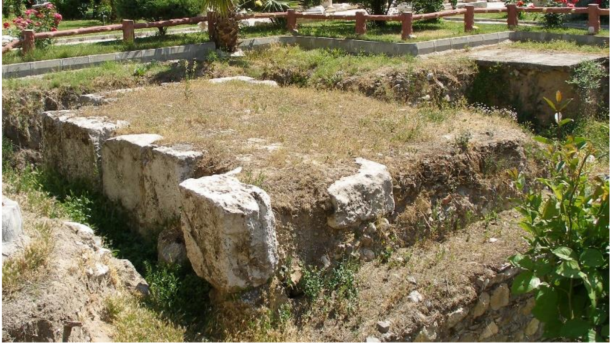
Ежелгі Филадельфия қалдықтары

21-ші ғасырда, Исаның айтуынша, ең адал Құдайдың Шіркеуінің (7-13 Аян 3) Филадельфия бөлігін тамтығы болар еді.