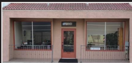
Continuing Church of God

Иса Өзінің Шіркеу жалғасатынын деді (Матай 16:18)