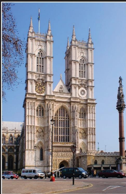
Church of England

кошуу 7 далилдер, ачкычын, жышаандарды Лаодикеядагы чиркөөлөрү аныктоого жардам берүү.