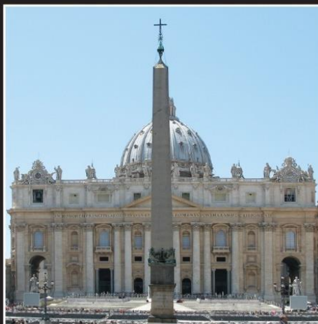
Church of Rome