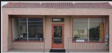
Continuing Church of God

Ыйса Өзүнүн чиркөө уланта турганын айтты (Матай 16:18)