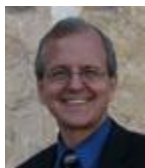
Ex editor in capite: Mors Thiel