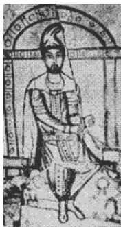
(3 er siglo)

Sacerdote de Mitra Papa León I el Papa Gregorio 13