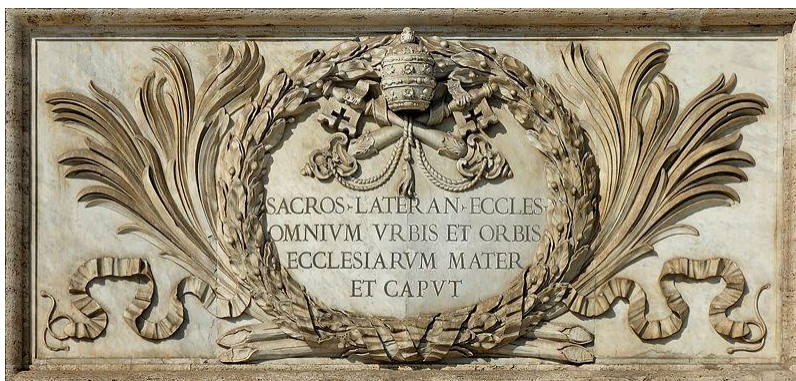
Cicero, basilicae S. Ioannis Lateranensis

Latini infra scriptum est interpretatum: