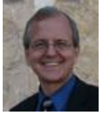
ОТ Главный редактор: Боб ТЕЛ