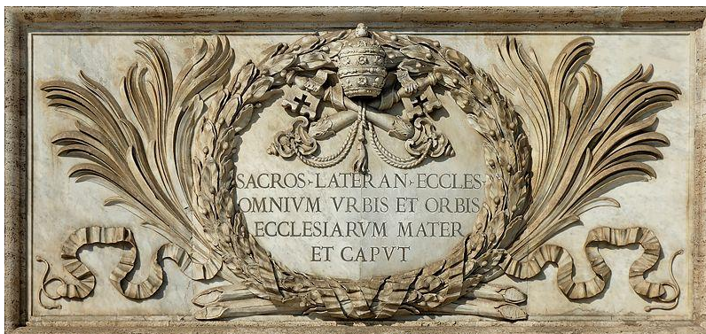
Надпись на базилики Святого Иоанна Латеранского

Обратите внимание на следующую надпись, которую я лично видел на многократные поездки в Рим на внешней СТОРОНЕ, что в некоторых отношениях, является наиболее важным собор в Риме: