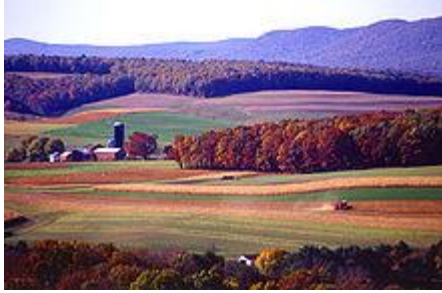
Герберт У. Армстронг из журнала простая истина , декабрь 1977

Видите ли вы светлое будущее? Для тебя? Для человечества? Лично я - и если вы можете присоединиться ко мне, говоря , что, вы один из ста тысяч!