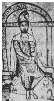
(3 - й век)